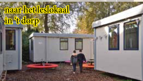
naar het leslokaal in 't dorp