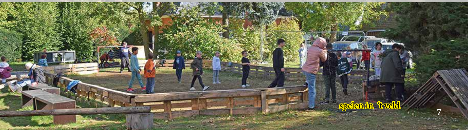
spelen in 't veld