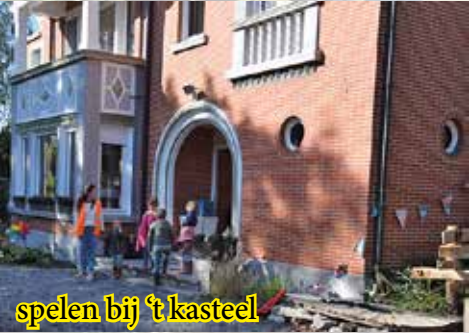
spelen bij 't kasteel