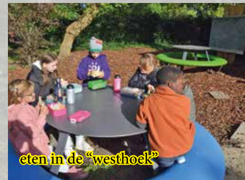
eten in de "westhoek"