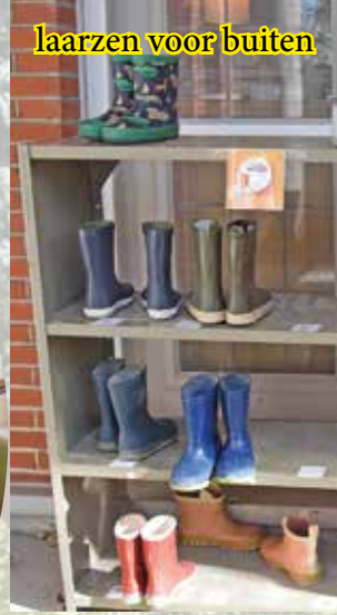
laarzen voor buiten