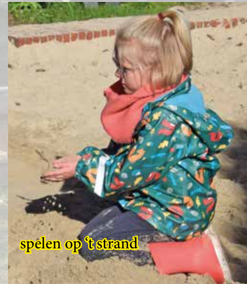
spelen op 't strand