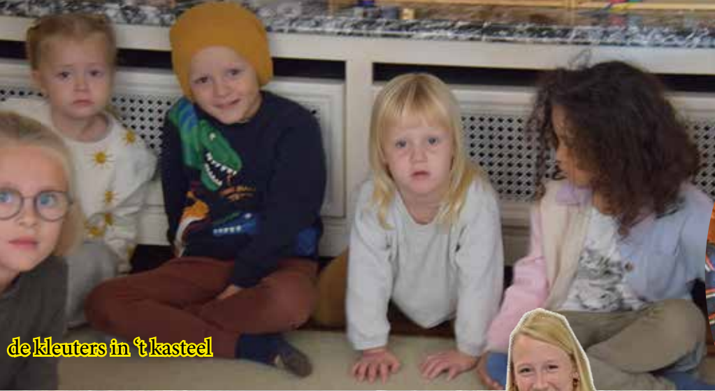
de kleuters in 't kasteel