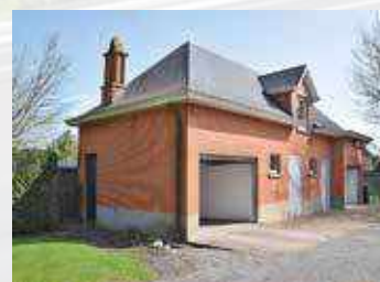
De kleuters komen in de garage/paardenstal.