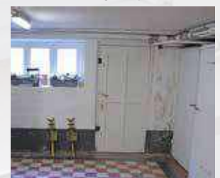
In de kelder komen toiletgroepen.